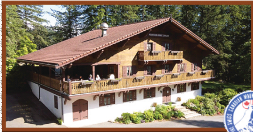
Swiss Canadian Mountain Range Association