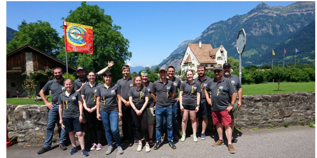
Société de Tir de Porsel au Tir Cantonal à Uri